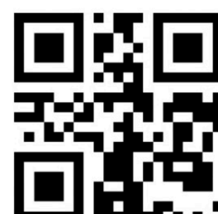
Illustration: Jens Ahlbom

Skriv även ditt namn, födelsedatum, program och klass på de papper som du lämnar in.